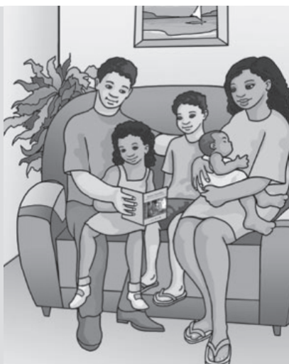
Figura 2 Família da cartilha Agenda de compromissos

Anteriormente o governo federal já havia produzido materiais voltados para as famílias alvo do PBF, entre eles a cartilha Agenda de compromissos . Numa linguagem acessível, o material oferece informações gerais do programa, das condições para o cadastramento etc. As ilustrações de famílias nucleares (pai, mãe e filhos) são predominantes no material, como a reproduzida na Figura 2. Nesse caso específico, não apenas o grupo social aparece idealizado, mas também o ambiente onde se encontra. Famílias nucleares também ilustravam outros materiais de divulgação publicados anteriormente, como a revista Desenvolvimento Social , editada pelo MDS em 2004. Contudo, tais imagens não correspondem à realidade, especialmente nas classes mais pobres. Sabe-se que hoje existem novos arranjos familiares (VITALE, 2002; ACOSTA & VITALE, 2003, CARVALHO, 2003) e cresce o número de famílias monoparentais, chefiadas mulheres – e esse era o perfil predominante no cadastro de Cariacica (SOBRINHO, 2006).